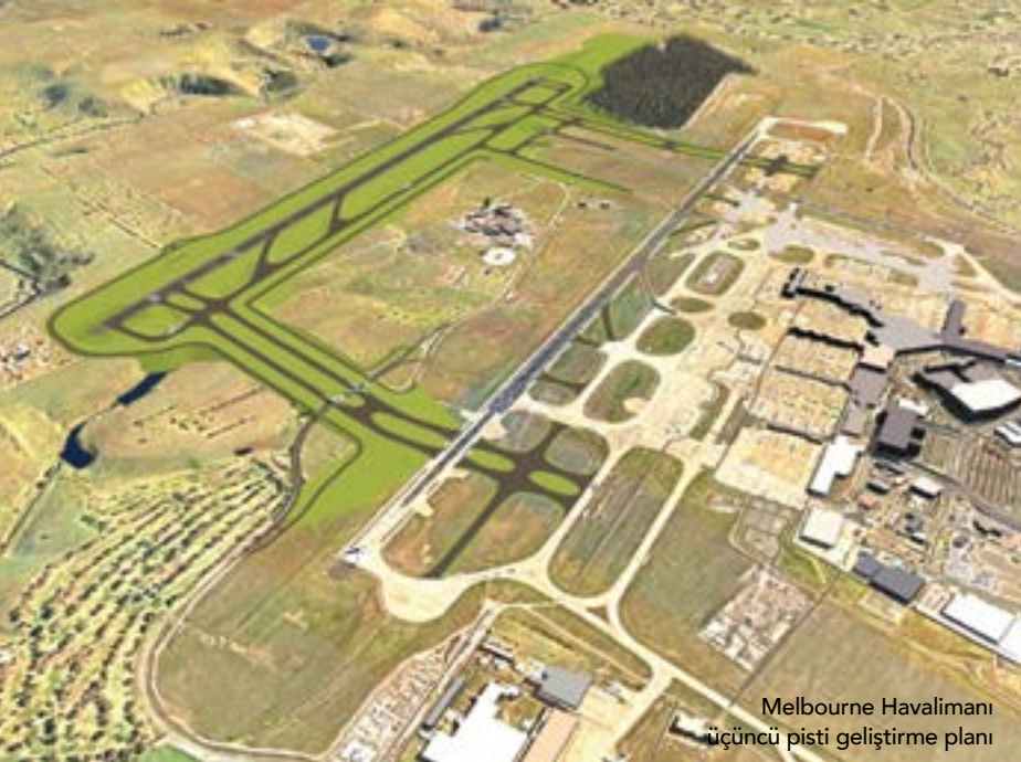
Melbourne Havalimanı üçüncü pisti geliştirme planı

Operasyonlarımız ve projelerimiz, pist planlarımız ve ilgili diğer gelişmelerden sizi haberdar etmek için hazırladığımız Melbourne Havalimanı Toplum Bülteninin birinci sayısına hoş geldiniz.