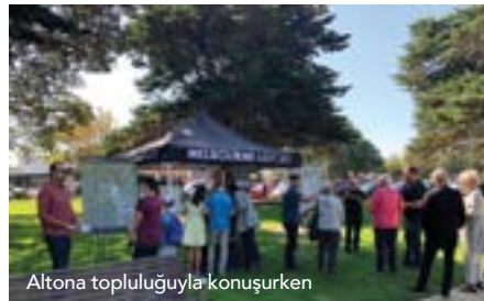
Altona topluluğuyla konuşurken

104 günlük danışma sırasında ekibimiz aralarında Keilor, Sunbury, Footscray, Altona, Bulla, Taylors Lake ve Sunshine'ın olduğu topluluklarda 50 yüz yüze bilgilendirme oturumuna, ayrıca pek çok çevrimiçi oturuma ev sahipliği yapmıştır.