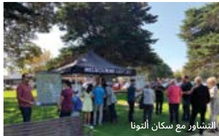
التشاور مع سكان ألتونا

خلال مرحلة التشاور التي استمرت لمدة 104 أيام، استضاف الفريق أكثر من 50 جلسة إعلامية وجهاً لوجه في مجتمعات شملت كيلور (Keilor) و سانبري (Sunbury) و فوتسكراي (Footscray) و ألتونا (Altona) و بولا (Bulla) و تايلورز لايكس (Taylors Lakes) و سانشاين (Sunshine)، بالإضافة إلى عدة جلسات عبر الإنترنت.