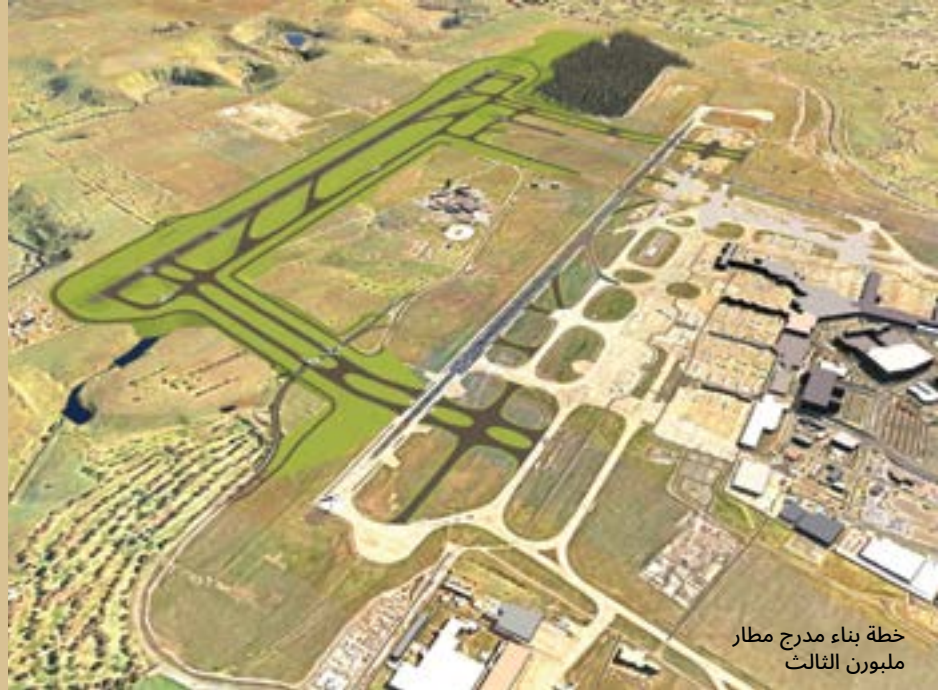
خطة بناء مدرج مطار ملبورن الثالث

يُعتبر مطار ملبورن مركزاً مهماً للشبكات الدولية والمحلية في أستراليا ويلتمس المطار حالياً موافقة الحكومة الفيدرالية لبناء مدرج جديد شمالي جنوبي سيؤدي إلى تغيير مسارات الطائرات حول ملبورن. من المهم أن نبقىك على اطلاع دائم بما يحدث وأن نستمر في معرفة ما هو مهم بالنسبة لك.